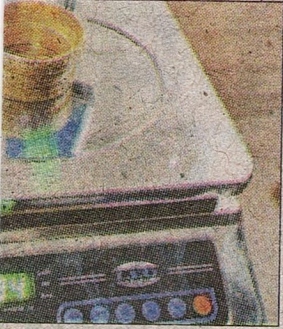
रा पकड़ा गया सोना। संवाद

अधिकारी यात्रियों के सामान की जांच कर रहे थे। इस दौरान अधिकारियों ने पाया कि तीन महिला